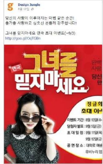
이벤트 및 홍보 진행 사례