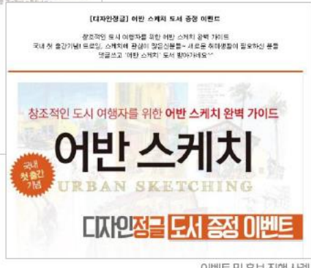
이벤트 및 홍보 진행 사례